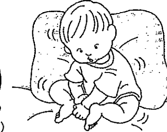
無理にさせられるお座り