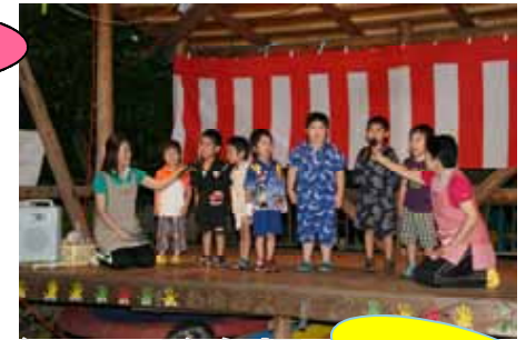
ひまわり・ふじ組 のど自慢