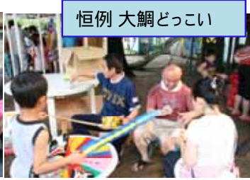
恒例 大綱どっこい